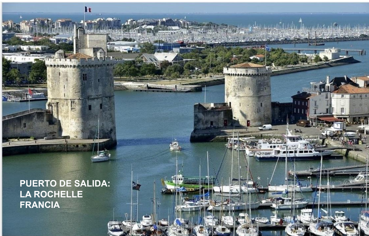
PUERTO DE SALIDA: LA ROCHELLE FRANCIA