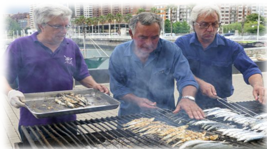
Sardines grillées, soupe de poule...